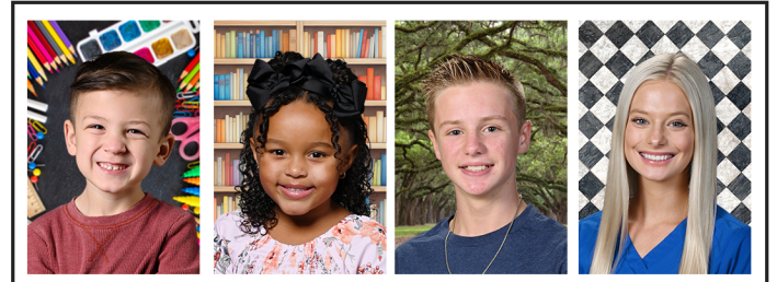
SOLO EN LÍNEA: Fondos Premium