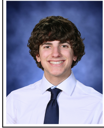
Ejemplo de otoño tradicional

Ordene en línea para descargar digitalmente de forma gratuita. No incluido con pedidos en papel.